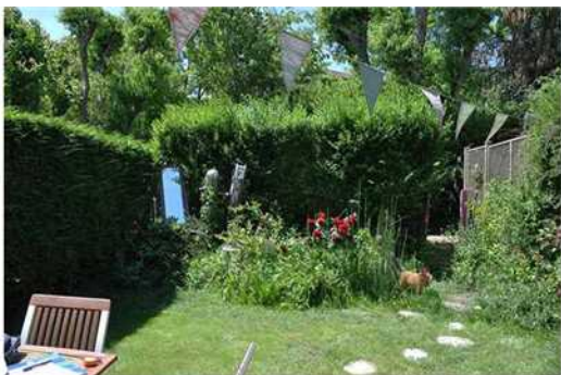
Un coin de verdure